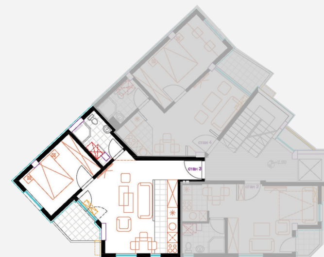
Ул. „Панко Брашнарoв“ бр.3 населба Хром